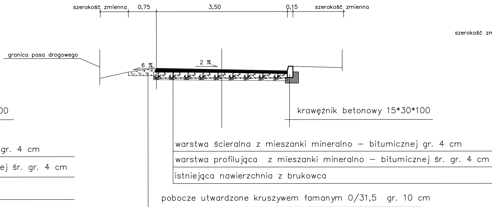
Przekrój B–B km 0+16,00 do km 0+101,50